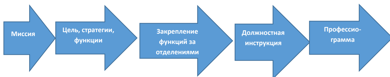
Рис.1 Организационное программирование по технологии инжиниринга

Разработка модели осуществлялась на основе технологии инжиниринга 14 .